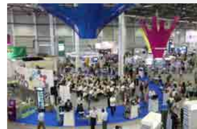
ОАО «МРСК Урала» представило долгосрочную программу энергоэффективности на ИННОПРОМ-2010

В Обществе создан оперативный ситуационный центр для информационного обмена о технологических нарушениях, чрезвычайных ситуациях, стихийных бедствиях.