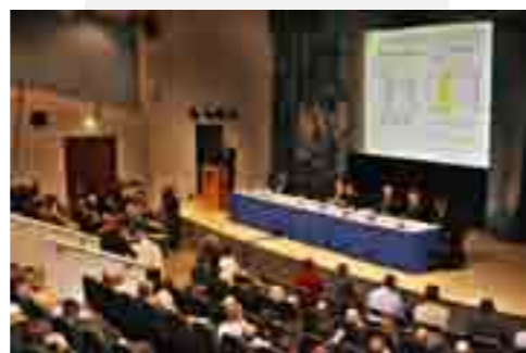
ОАО «МРСК Урала» представила свои проекты на всероссийском совещании по энергосбережению