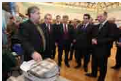
Компания презентовала лабораторию по энергосбережению на выставке, посвященной энергосбережению и энергоэффективности.

Правительство Пермского края одобрило выполнение инвестиционной программы Пермэнерго.