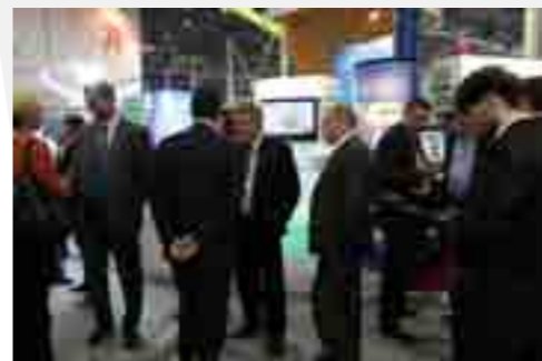
Компания приняла участие в конференции «Распределительный сетевой сектор РФ: состояние, проблемы, пути решения»