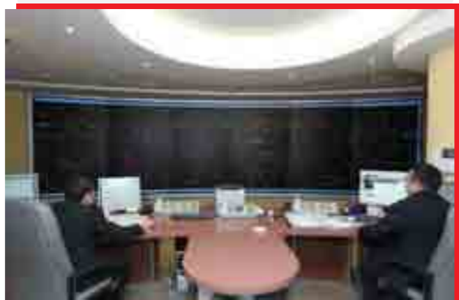
Филиал «Свердловэнерго» запустил в работу новый диспетчерский щит (г. Кировград).