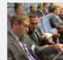
Состоялось годовое общее собрание акционеров.

Правительство Пермского края одобрило выполнение инвестиционной программы Пермэнерго.