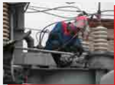
Филиал «Пермэнерго» завершил ремонт 4 крупных подстанций в г. Пермь.