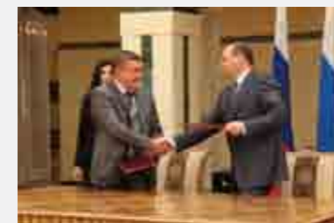
Правительство Свердловской области и ОАО «МРСК Урала» подписали соглашение о сотрудничестве в рамках стратегического развития Свердловской области